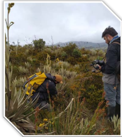
Imagen: 3