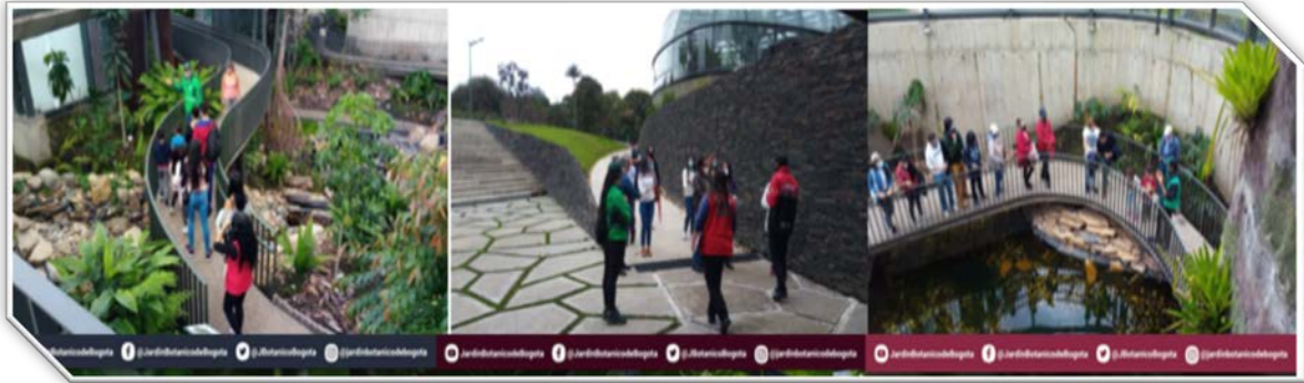
Imagen: 5