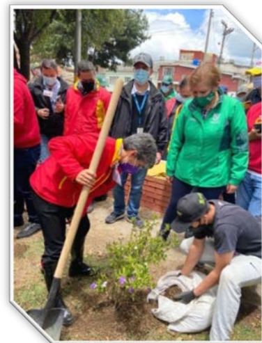
Imagen: 10

Ahora bien, dentro de las localidades con mayor porcentaje de plantación, se encuentran Suba con el 13%, Fontibón con 12% y Ciudad Bolívar con el 11%, la localidad con el porcentaje más bajo es la Candelaria con 20 individuos representado, el 0,12%, lo anterior, es debido a la escasa área potencial de plantación en espacio público de uso público.