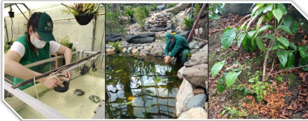
Imagen: 4 Fuente: JBB-JCM – Reporte PMR.

Durante el último trimestre de la vigencia 2021, se accesaron 10 especies distintas, las cuales fueron accesadas en las colecciones de Bosque Seco y Amazonas, en las colecciones de plantas útiles y colecciones especializadas para la Conservación -CEPAC. De esta manera, se da por cumplido al 100%, el indicador PMR planteado para la vigencia 2021.