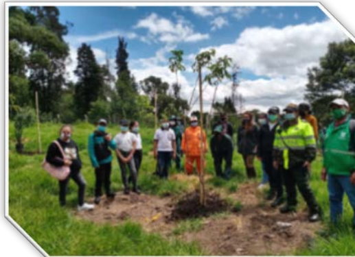
Imagen: 6

Participación en territorio: asistentes a las redes de cuidadores, asistentes a las jornadas de replantando confianza, espacios de diálogo, formación en territorio, recorridos, entre otros.