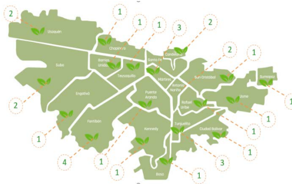
Imagen: 7

Se ha logrado la implementación de 30 redes de cuidadoras y cuidadores en todo el territorio de Bogotá, para el mantenimiento y protección de las coberturas vegetales y la flora de la ciudad.