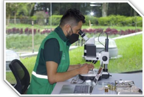
Imagen: 2

Las líneas de Investigación que se encuentran en desarrollo son: Flujo de Carbono, Conectividad, Flora, Colección de Referencia, Colección Viva, Disturbio, Paisaje, Propagación, Sanidad, Bioprospección, a continuación, se relacionan algunos de los avances alcanzados.