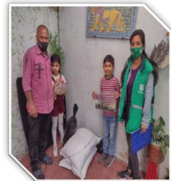
Imagen: 9

Durante la vigencia 2021 se realizó la capacitación a 6.351 personas en técnicas y tecnologías agroecológicas para la producción de huertas urbanas y periurbanas.