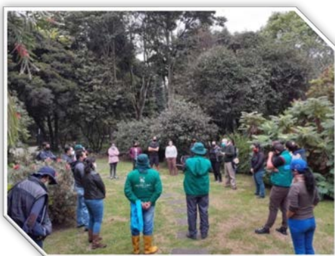
Imagen: 11

Durante el periodo de reporte se adelantaron espacios de fortalecimiento del tejido social en las localidades de la Engativá y Antonio Nariño potencializar las practicas agroecológicas como elaboración de semilleros y entrega de semillas.