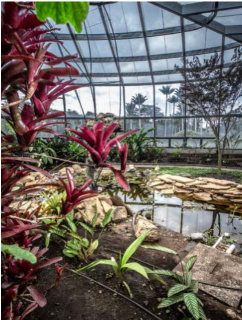
Imagen: 2

Avance: Durante el periodo comprendido entre el 1 de abril y el 30 de junio de 2021, se accesaron 15 especies distintas, entre las cuales se encuentran agave stricta , Erythroxyllum haughtii , Priva lappulacea , Salpichlaena volubilis y Vachellia farnesiana , Dorstenia contrajerva , Rhipsalis baccifera , Clusia grandiflora , Osmunda regalis , Rhipsalis pilocarpa , Pitcairnia croatii , Philodendron serpens , Pitcairnia dolichopetala , Prestoea ensiformis y Pitcairnia lehmannii . las especies accesadas fueron establecidas en las colecciones de Selva Chocó, en las colecciones de Bosque Seco y Plantas Útiles.