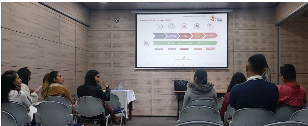
Registro Fotográfico Capacitación Veeduría Distrital dirigida a Equipo Rendición de Cuentas (marzo 2020)

recibe capacitación por parte de la Veeduría Distrital sobre el proceso de Rendición de Cuentas, normatividad aplicable, responsabilidades entre otros; con el propósito de abordar la metodología e iniciar la distribución de labores frente al ejercicio de Rendición de Cuentas de la gestión del año 2020.