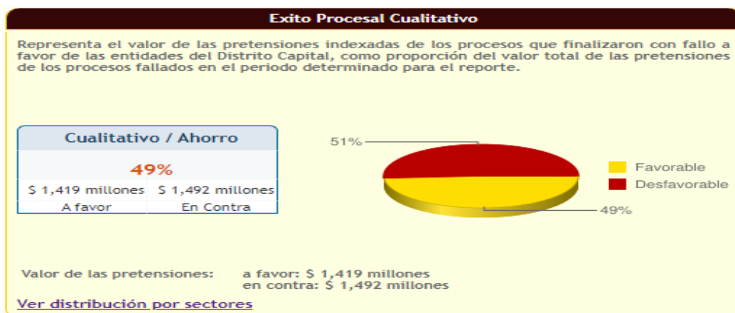
Imagen N° 4. Porcentaje éxito procesal cualitativo y cuantitativo 01-01-2020- 10-05-2022. Fuente. Diagnóstico SIPROOJ WEB SJD del 10-05-2022.

Dentro de la mencionada circular se insta a las Entidades Distritales que ejercen la representación judicial en los procesos relacionados con su objeto y funciones, a que se involucren de manera activa para mantener o superar el referido indicador, teniendo en cuenta que este resulta ser transversal a toda la gestión jurídica distrital y que por lo tanto, las acciones necesarias para dar cumplimiento a la meta 487 resultan ser una labor mancomunada que se encuentra a cargo de todas las entidades públicas de Bogotá D.C, hecho por el cual es fundamental que estas realicen —entre otras— las siguientes acciones: