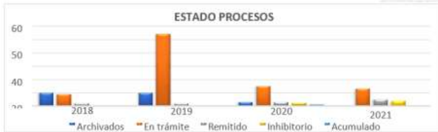
Gráfica N° 1. Medición Estado procesos disciplinarios.