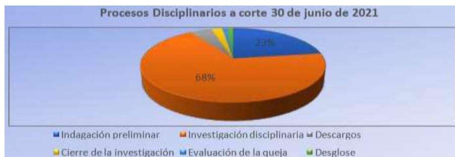
Gráfica N° 2. Porcentajes etapas procesos disciplinarios. Fuente. Elaboración Propia