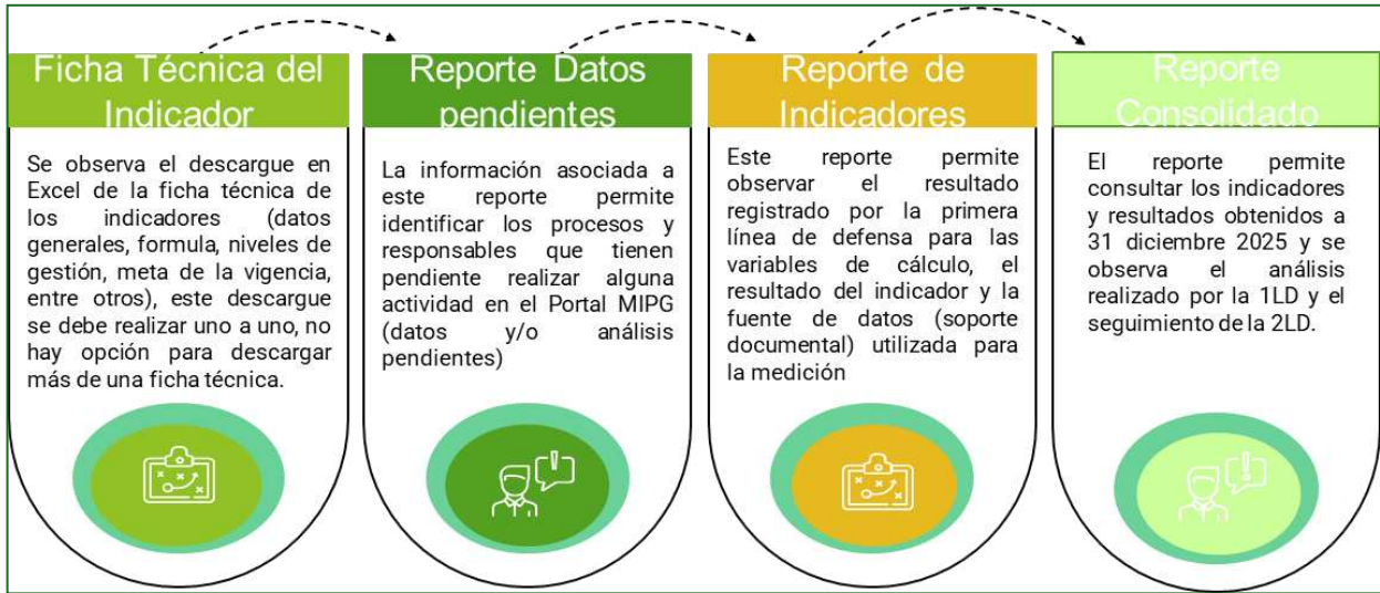
Imagen N°4. Elaboración Propia. Fuente: Verificación realizada por la OCI.