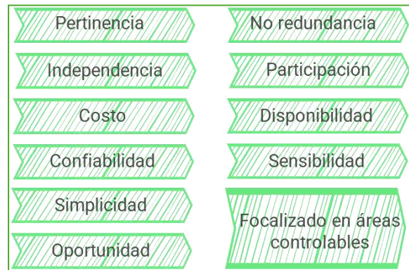
Imagen N°3. Elaboración Propia. Fuente: Guía del DAFP para la construcción y análisis de indicadores de gestión (v4) e Instructivo DYP.PR.04.I.01 - Formulación y/o actualización de Indicadores (v13).

En consecuencia, se concluye que la totalidad de los 33 indicadores vigentes continúan cumpliendo con las características técnicas definidas en los instrumentos mencionados.