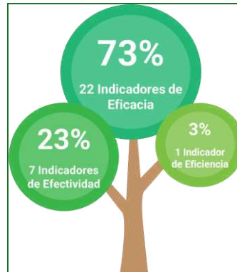
Imagen N°2. Elaboración Propia. Fuente: Reporte Consolidado – Portal MIPG.