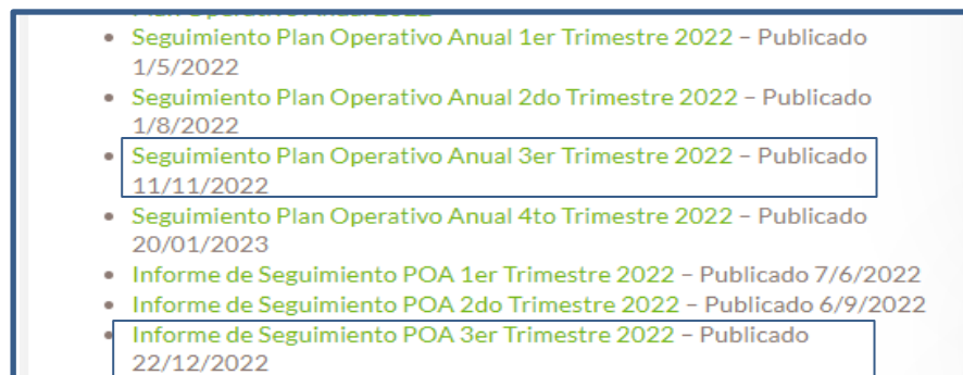
Imagen 1. Captura de pantalla consulta Web JBB (02-02-2023 2022)

Una vez consultada la página web, se evidenció la publicación extemporánea del informe POA para el tercer trimestre 2022 (publicado el 22 de diciembre de 2022) y no se observa la publicación del informe correspondiente al cuarto trimestre, toda vez que este informe debió publicarse máximo el 27 de enero de 2023.