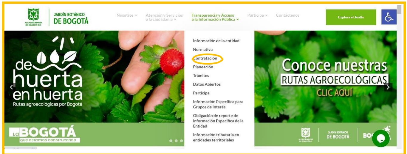
Imagen N° 3. Enlace transparencia. Fuente. Página web JBB-JCM.

https://jbb.gov.co/transparencia/contratacion/