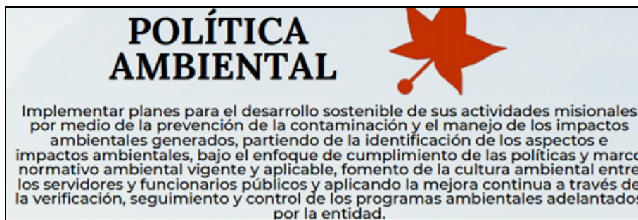
Imagen 1.

5.1.5 Política ambiental de la entidad (Artículo 10): En documento PIGA 2021-2024, se encuentra de relacionada la actual política ambiental de la entidad. Así mismo, en el mencionado plan se informa que “Esta política es socializada a los servidores de la entidad en las diferentes capacitaciones y actividades relacionadas con los programas del Plan Institucional de Gestión Ambiental, así como a través de correos masivos enviados los correos institucionales de la entidad. La política también se encuentra publicada en la página web, siendo de conocimiento de toda la ciudadanía interesada”