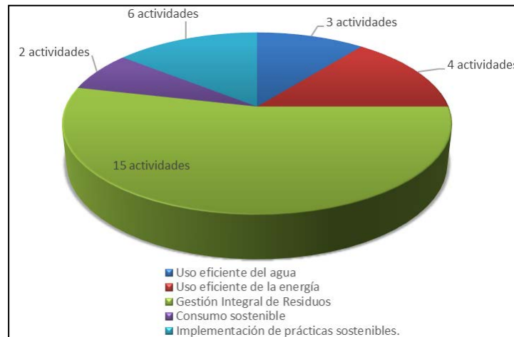
Gráfica 2. Elaboración Propia. Fuente: Archivo Plan de Acción PIGA OCTUBRE MIPG – Unidad USIG

En el avance de las actividades verificadas se presenta a continuación y las evidencias se encuentran publicadas en la ubicación relacionada en el seguimiento del Plan de Acción PIGA 2021.