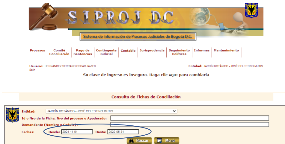
Imagen N°1. Consulta registro fichas de conciliación. Fuente. SIPRO WEB. Corte 31-05-2022

Se realizó revisión a las fichas del Comité de Conciliación registradas en el Sistema SIPROJ-WEB por parte del apoderado de la entidad durante el período objeto de seguimiento y no se evidenció registro de fichas de conciliación, como se muestra a continuación: