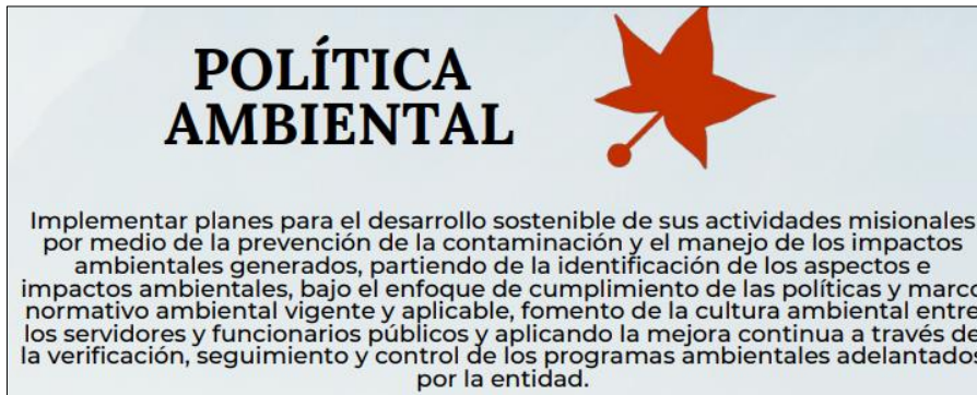
Imagen 4.

ALCALDÍA MAYOR DE BOGOTÁ D.C. Jardín Botánico José Celestino Mutis